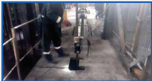
Defektoskopická kontrola ťažného lana Defectoscopy inspection of the hoisting cable