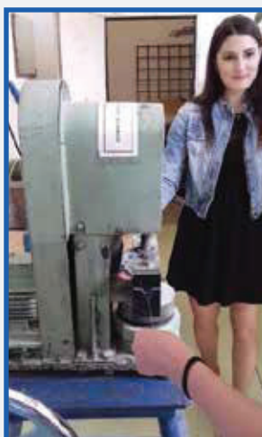
Rovnanie drôtov vypletených z oceľového lana Straightening of the wires from steel wire rope