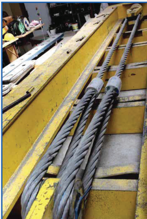
Skúška nosnosti viazacieho prostriedku Axial load test for self-lifting accessories