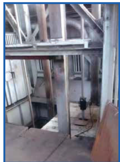
Defektoskopická kontrola ťažného lana Defectoscopy inspection of the hoisting cable