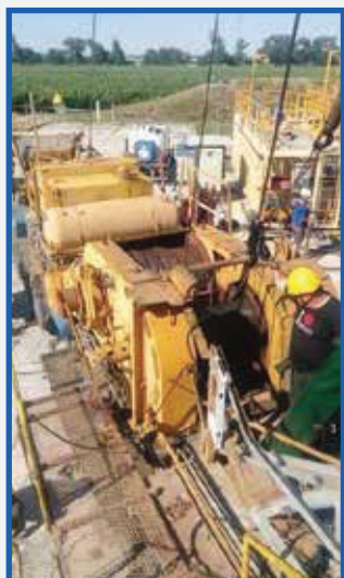
Defektoskopická kontrola kladkostrojového lana vrtnej veže Defectoscopy inspection of the hoist rope the drilling derrick