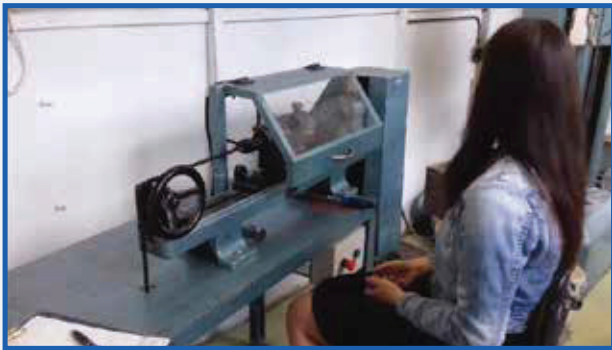
Skúška oceľového drôtu v krútení Test of steel wire in the torsion