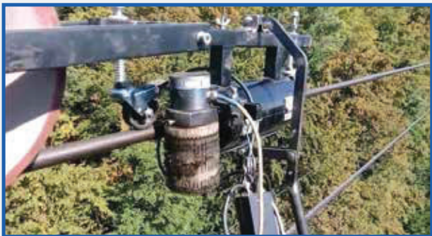
Defektoskopická kontrola nosného lana lanovej dráhy Defectoscopy inspection of carrying rope of the cableway