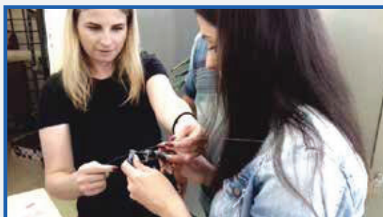
Meranie priemeru drôtu Measurement of diameter the steel wire