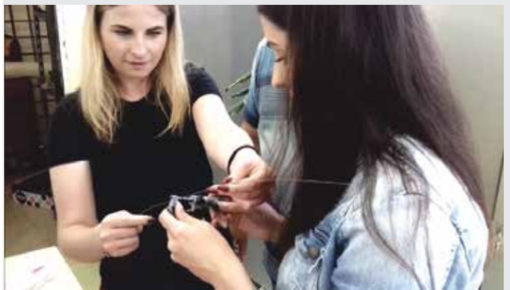
Meranie priemeru drôtu / Measurement of diameter the steel wire