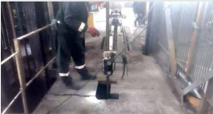
Defektoskopická kontrola ťažného lana / Defectoscopy inspection of the hoisting cable