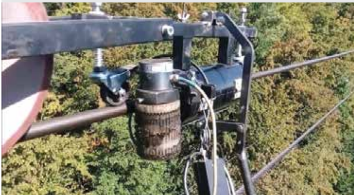
Defektoskopická kontrola nosného lana lanovej dráhy / Defectoscopy inspection of carrying rope of the cableway