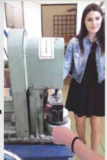
Rovnanie drôtov vypletených z oceľového lana / Straightening of the wires from steel wire rope