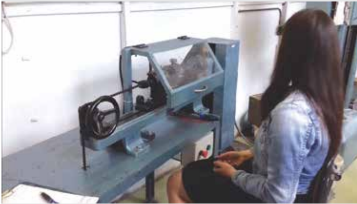
Skúška ocelového drôtu v krútení / Test of steel wire in the torsion