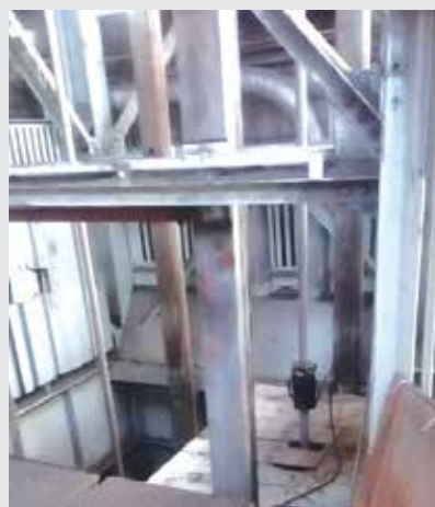
Defektoskopická kontrola ťažného lana / Defectoscopy inspection of the hoisting cable