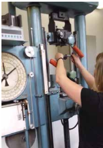
Meranie nosnosti oceľového drôtu / Measurement of axial load the steel wire