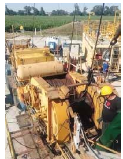
Defektoskopická kontrola kladkostrojového lana vrtnej veže / Defectoscopy inspection of the hoist rope the drilling derrick