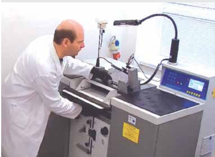
Zrezanie krycej vrstvy dopravného pásu / Splitting the cover layer of conveyor belt