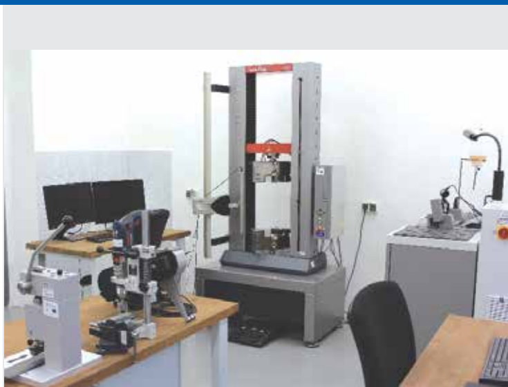
Pohľad na vybavenie laboratória / View on devices in laboratory