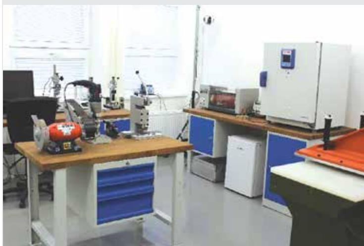
Pohľad na vybavenie laboratória / View on devices in laboratory