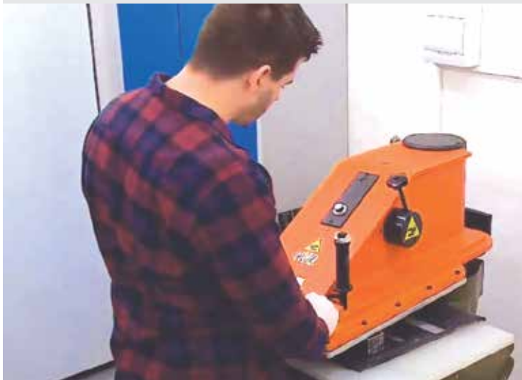
Vyseknutie skúšobného telesa dopravného pásu / Cutting the specimen of conveyor belt