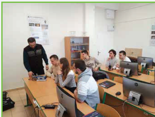
Prednáška v laboratóriu trhacích prác Lecture in the laboratory of blasting

Svojim softvérovým vybavením toto laboratórium umožňuje jeho využitie aj pre riešenie úloh v oblasti plánovania ťažby nerastov, modelovania lomov, projektovania technologických liniek na výrobu kameniva a pod.