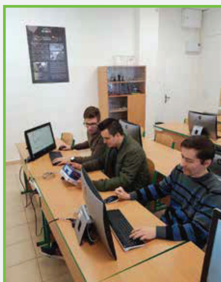
Počítačové plánovanie a vyhodnocovanie odstrelov v laboratóriu trhacích prác Computer planning and evaluation of blastings in the laboratory of blasting