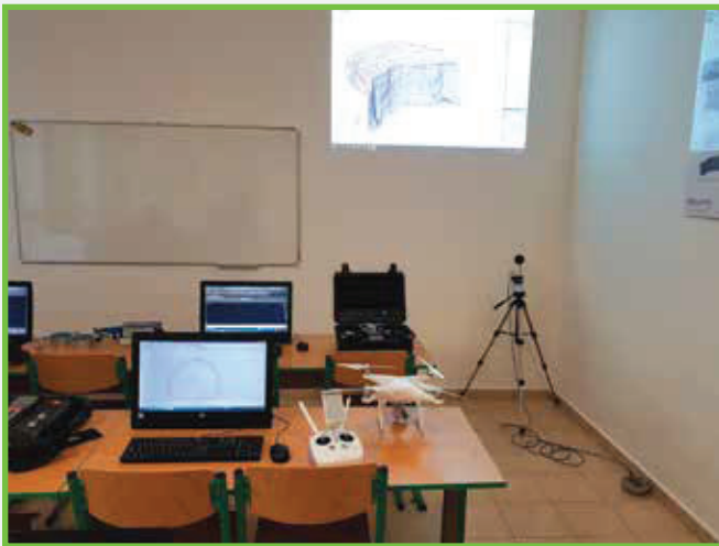
Propagačná prezentácia v laboratóriu trhacích prác Presentation in the laboratory of blasting