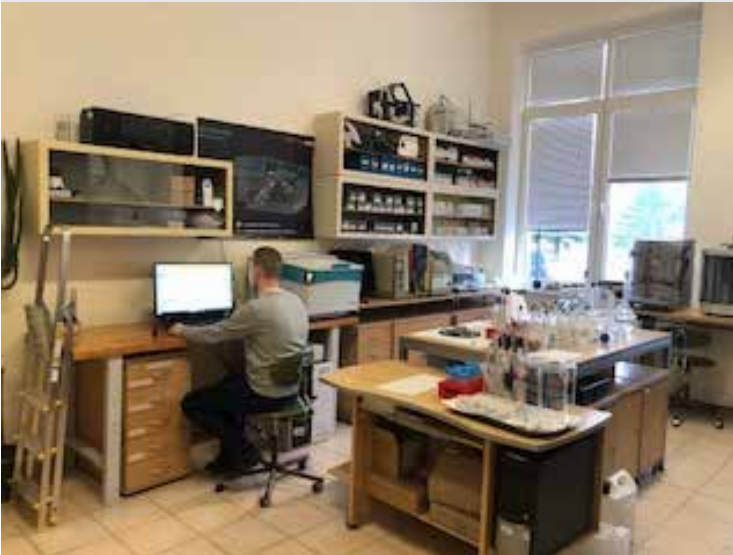
Analýza vzoriek pomocou röntgenového fluorescenčného spektrometra -XRF / Analysis of the samples using XRF spectrometer

XRF (X-ray fluorescence) is a non-destructive analytical technique used to determine the elemental composition of materials. Using this technique, XRF analyzers are excited by a primary X-ray source and the chemistry of the sample is determined by measuring the X-ray fluorescence emitted from the sample. Each of the elements present in the sample produces a set of characteristic X-ray fluorescence that is unique to that specific element. Therefore, XRF spectroscopy is recognized as an excellent technology for qualitative and quantitative analysis of material composition. Most atoms have several electron orbitals. When X-ray energy causes electrons to enter and exit these orbital levels, XRF peaks of varying intensity are produced throughout the spectrum.