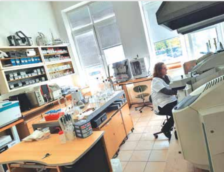
Práca v analytickom laboratóriu / Working in the analytical laboratory