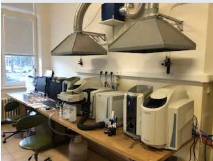
Atómový absorpčný spektrometer pre chemickú analýzu / Atomic absorption spectrometer for chemical analysis AAS

XRF (röntgenová fluorescencia) je ne-deštruktívna analytická technika používaná na určenie elementárneho zloženia materiálov. Pomocou tejto techniky sú analyzátory XRF excitované primárnym zdrojom röntgenového žiarenia a chémia vzorky sa určuje meraním fluorescence röntgenového žiarenia emitovaného zo vzorky. Každý z prvkov prítomných vo vzorke vytvára súbor charakteristickej röntgenovej fluorescence, ktorá je jedinečná pre tento špecifický prvok. Preto je XRF spektroskopia uznávaná ako vynikajúca technológia pre kvalitatívnu a kvantitatívnu analýzu zloženia materiálu. Väčšina atómov má niekoľko elektrónových orbitálov. Keď röntgenová energia spôsobí, že elektróny vstúpia a vystúpia z týchto orbitálnych úrovní, v celom spektre sa vytvoria vrcholy XRF s rôznou intenzitou.