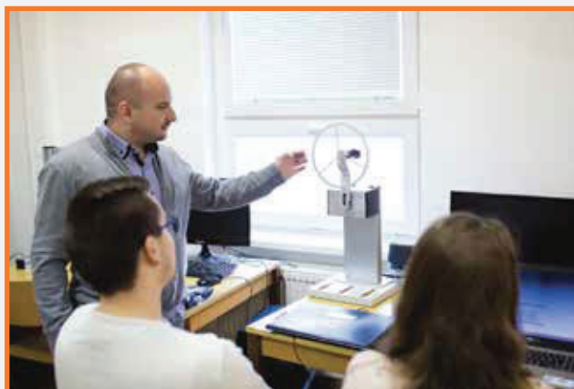
Ukážka riadenia objektu „B&R reaction wheel pendulum“ Illustration of control of the B&R reaction wheel pendulum

Laboratórium priemyselných riadiacich systémov bolo vytvorené pre výučbu predmetov súvisiacich s technickou stránkou a s programovaním riadiacich automatov, procesorov, frekvenčných meničov a pre samostatnú prácu študentov na semestrálnych projektoch a diplomových prácach a tiež pre výskumnú činnosť v danej oblasti. Laboratórium je vybavené najmodernejšou technikou ako sú napríklad PLC automaty, power panely, frekvenčné meniče, rôzne typy procesorov, rôzne objekty riadenia, meracie prístroje, atď. Laboratórium sa v súčasnej dobe okrem výučby využíva aj pri riešení domácich a zahraničných výskumných grantov pracoviska, hlavne na praktické overovanie dosiahnutých teoretických výsledkov.