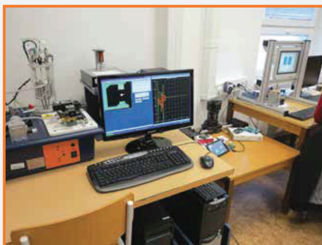
Ukážka magnetickej levitácie Illustration of magnetic levitation