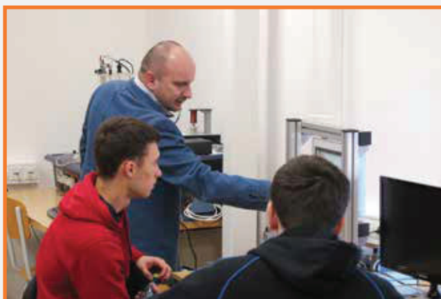
Ukážka programovania power panelu Illustration of power panel programming