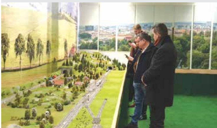
Návšteva verejnosti v laboratóriu železničnej dopravy počas dňa otvorených dverí / Visit of the public in the railway transport laboratory during the open day