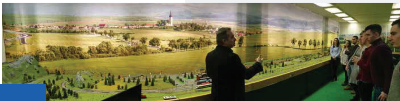
Perfect, detailed processing of objects and elements of the railway model and their spatial distribution on one of the largest railway models in the Slovak Republic in the railway transport laboratory. The dimensions of the model railway reach a stunning 14 x 4.4 meters. The total length of the model's railways is 96 meters.