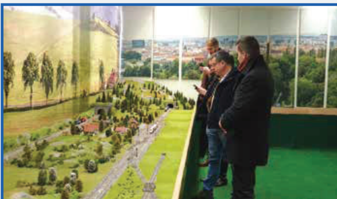
Návšteva verejnosti v laboratóriu železničnej dopravy počas dňa otvorených dverí. Visit of the public in the railway transport laboratory during the open day.