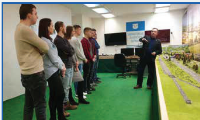
Oboznámenie študentov s prácou v laboratóriu železničnej dopravy. Familiarization of students with work in the railway transport laboratory.

A panoramic view of the railway transport laboratory, which illustrates the size of a functional model of the railway.